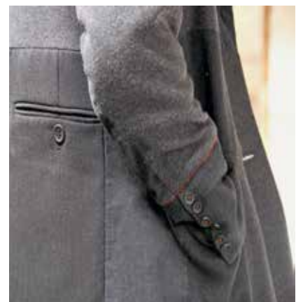
Hergestellt ist er aus Altkleider.