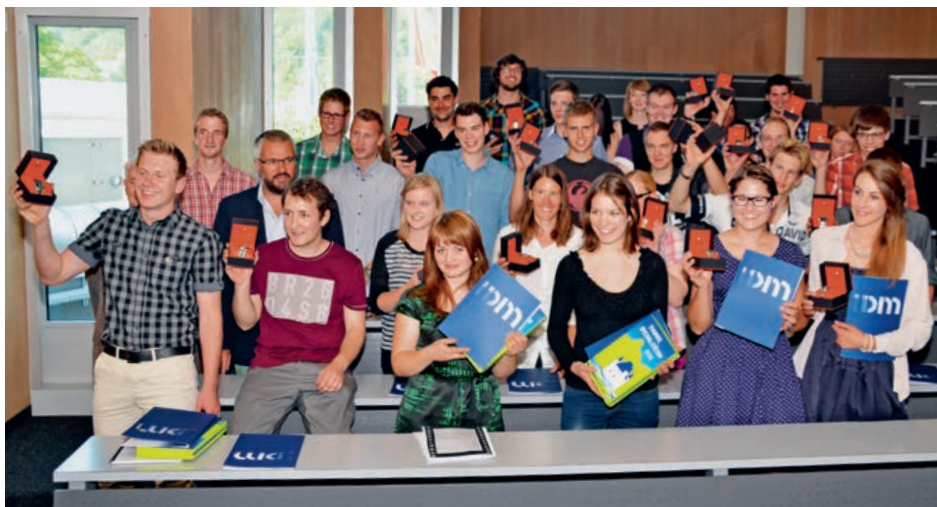
Die frisch gekürten Kaba- und Kiwanis-Preisträgerinnen und Preisträger