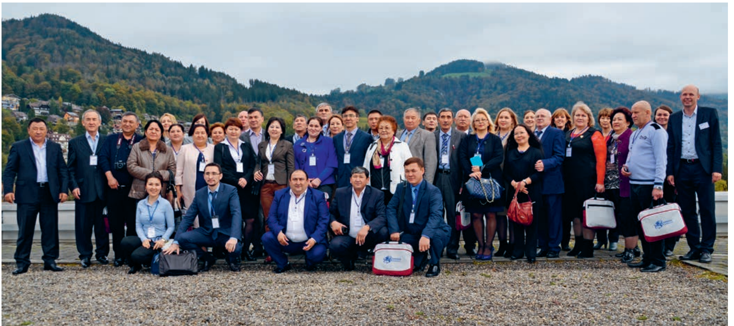
Die grosse kasachische Delegation vereint auf dem Gruppenbild