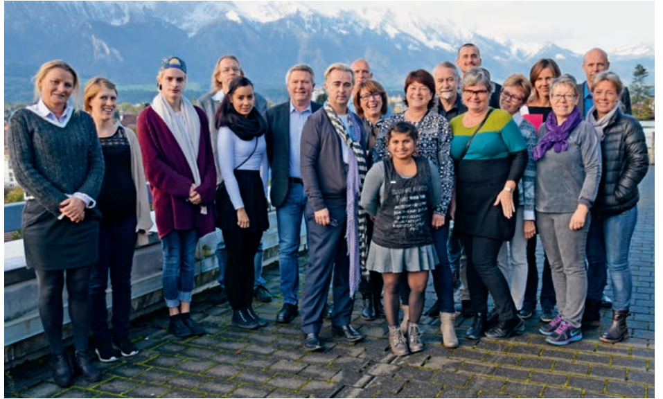
Die norwegische Gruppe mit Lernenden ist sehr an unserem dualen Ausbildungssystem interessiert