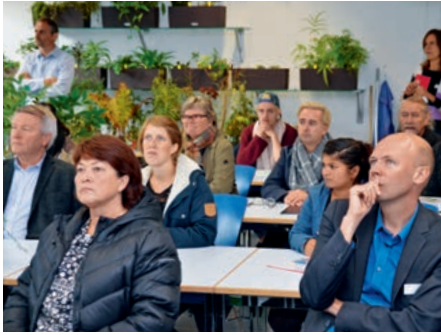
Gespanntes Zuhören bei den Floristen