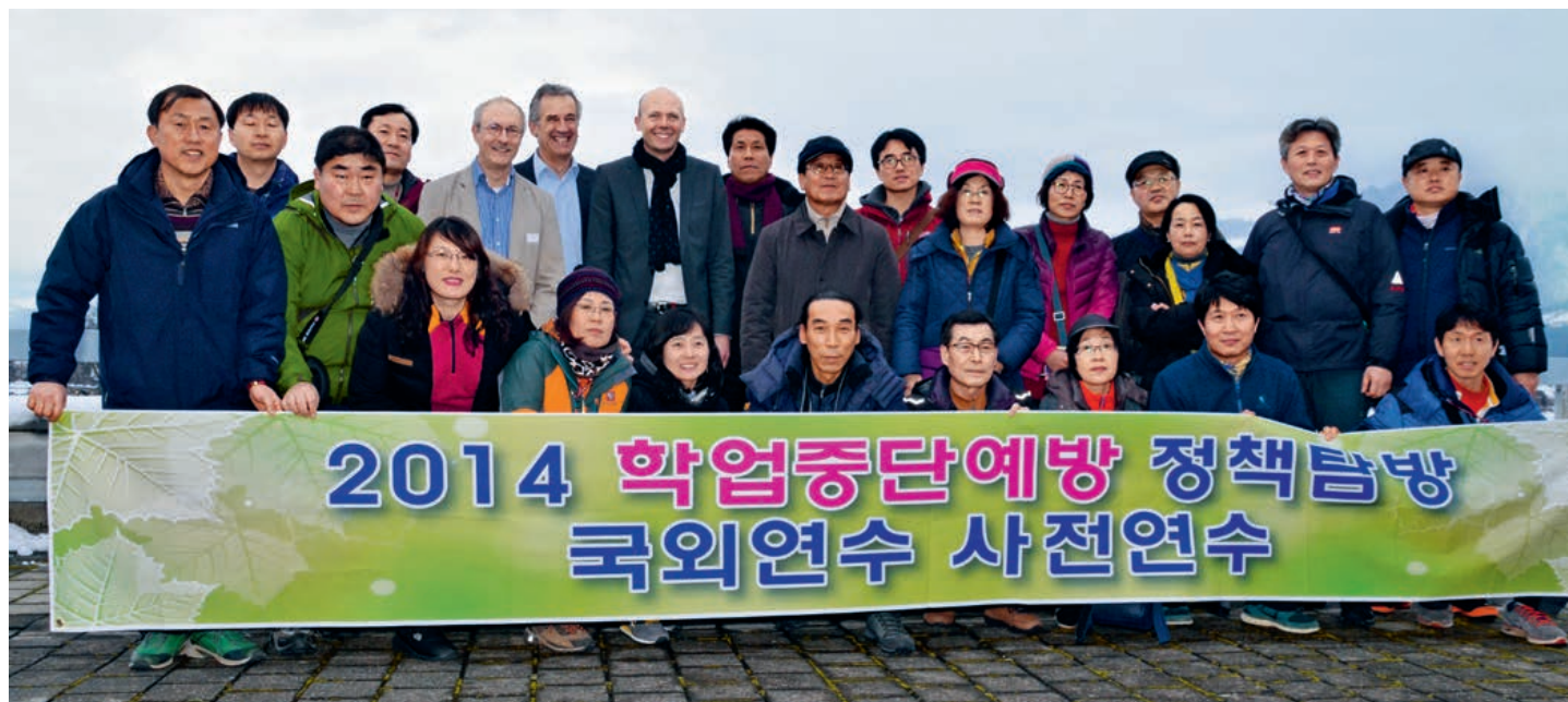
Die südkoreanische Delegation auf dem Dach des BBZ IDM Thun mit ihrem imposanten Banner

Eine dem Menschen natürlich innewohnende Kompetenz ist, dass er beim Aufnehmen von Neuem im Hirn immer die Vernetzung zum bereits Bestehenden herstellt. Durch diesen Prozess entstehen neue Verknüpfungen und neue Ideen. Der Austausch von Erfahrungen, das Aufnehmen von Anderem führt folglich zur Entwicklung von neuen Perspektiven. Neue Perspektiven führen zu Innovationen und weiterführender Entwicklung. Wir verfolgen deshalb das Ziel, in permanentem Austausch mit anderen Institutionen im In- und Ausland zu stehen.