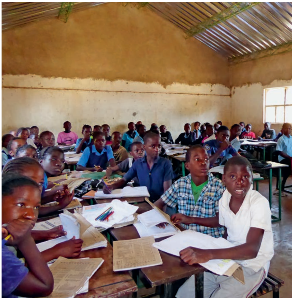
Schulbetrieb unter den neuen Dächern an der Kakumbi School