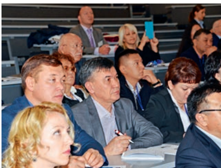
Aufmerksame Zuhörer aus Kasachstan, die viel neues Wissen mit in ihre Heimat nahmen