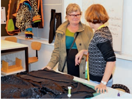
Norwegische Lehrperson im Gespräch im Couture Ateliers BBZ IDM Spiez