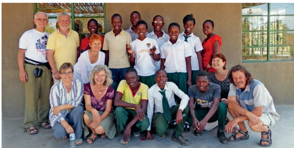
Eine Delegation von «Schulprojekte Sambia», zusammen mit vom Verein gesponserten SchülerInnen